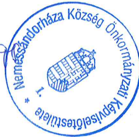
Molnár Gyöngyi kirendeltség-vezető